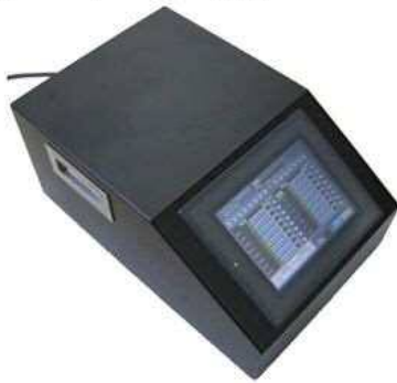
【センシングシステム本体】